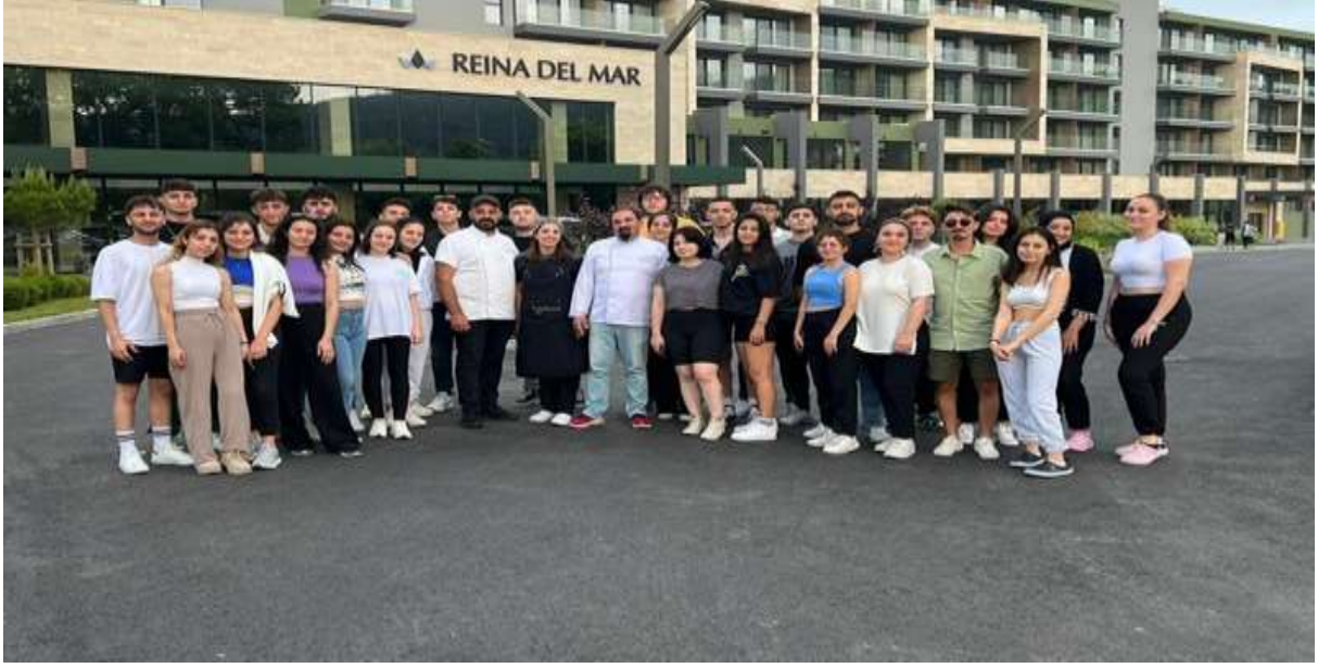
Resim 11. Aşçılık Öğrencilerinin Reina Del Mar Otelindeki Stajları